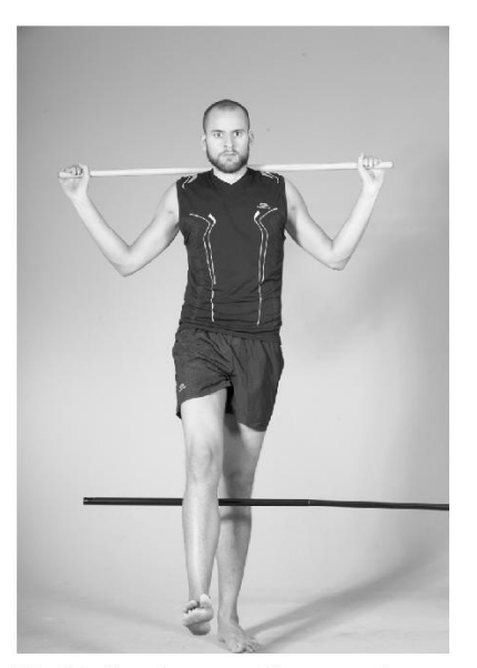
Fig. 3.2. Scavalcamento di un ostacolo.

Capitolo 3 - Test di valutazione funzionale avanzata